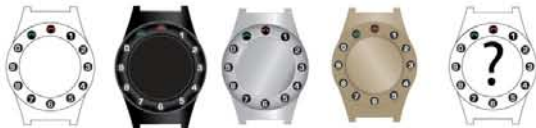
blanco negro plata oro Colores especiales a partir de 500uds.